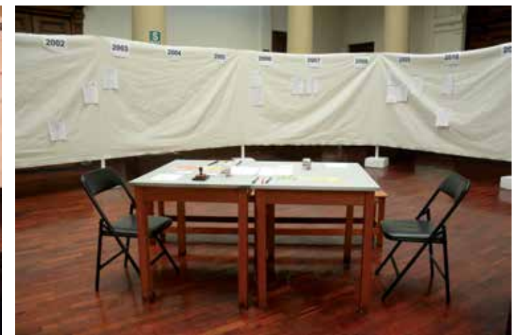
(re) Acciones Públicas. Intervenciones, activismos y ocupaciones: centro histórico de Lima, 1992-2016. Detalle de mesa y banderola.